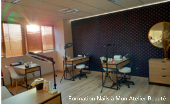
Formation Nails à Mon Atelier Beauté.

sur modèle (sauf pour le nail art). Je travaille également avec des marques de qualité, professionnelles, accessibles.