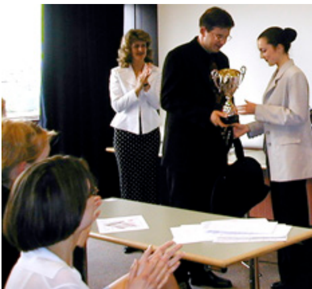
Gagnante du Championnat de France de Manucure.

Le Lycée Privé d'Esthétique de Touraine a toujours eu vocation de mettre en avant ses élèves et de les challenger. À l'occasion du Championnat de France de Manucure réservé aux élèves, la gérante de l'école a organisé des présélections au sein de l'école. J'ai été présélectionnée et coachée. Pour les épreuves, nous avons de tout : résine, capsule, pansement, vernis nacré, vernis laqué, french manucure. Je suis arrivée troisième. Un peu vexée, je me suis représentée l'année suivante et cette fois-ci, je suis arrivée la première au concours ! Je ne suis pas une compétitrice dans l'âme mais c'était une belle victoire personnelle et c'était aussi l'occasion de prendre ma revanche sur les idées préconçues de la profession, il faut énormément de qualité pour réussir en esthétique.