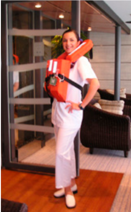
Esthéticienne en croisière !